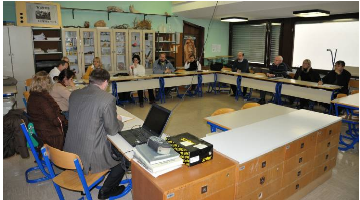
Udeleženci 1. delavnice so se pogovarjali o dobrih praksah v delu svetov staršev

Vsi udeleženci delavnice so povedali, da imajo najmanj dve redni seji, ostale so lahko po potrebi dopisne ali izredne. Večina je povedala (8 od 14 udeležencev), da so seje vsaj tri, dva pa, da jih je štiri, pet ali več.