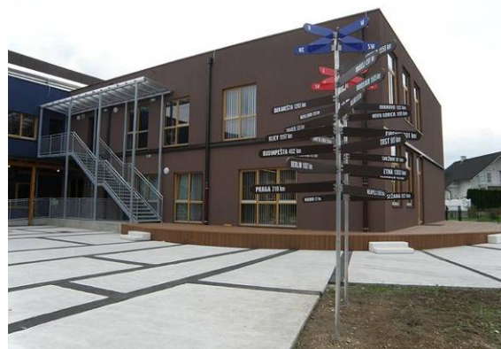
Nova osnovna šola Brezovica pri Ljubljani

ozvočenjem. Imamo učilnice na prostem, igrišče z igrali in plezalno steno ter veliko presostanično telovadnico. V šoli je tudi dvigalo in oprema, ki je prilagojena za osebe s posebnimi potrebami.