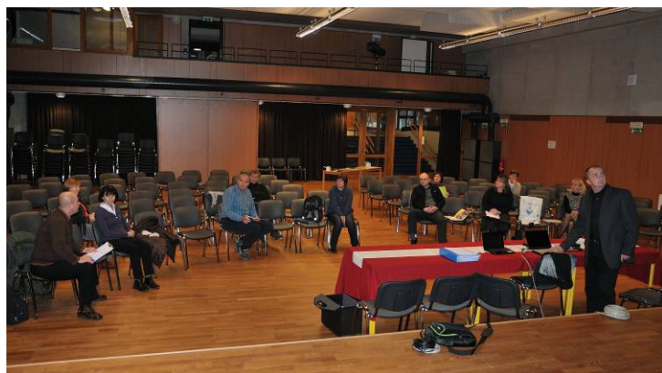
Udeleženci 2. delavnice so se o učbenikih pogovarjali kar v največji dvorani