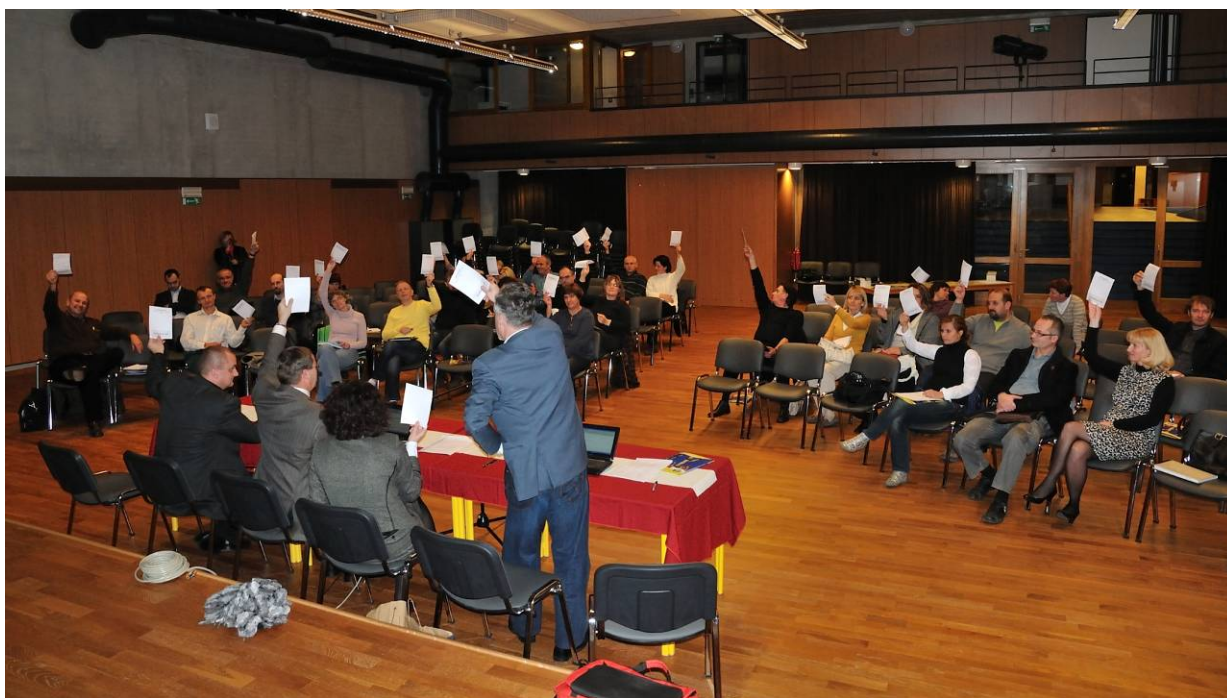
Udeleženci 1. redne skupščine pri glasovanju o pravilih delovanja ZASSS

Zapisali Nadja Šiškovič Kofol, Andrej Tavčar, Janko Korošec