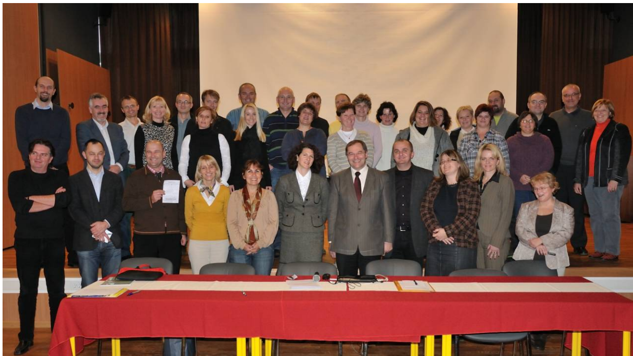
Udeleženci 1. redne skupščine ZASSS