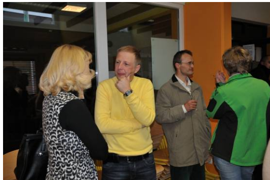
Po koncu uradnega dela posvetovanja in skupščine so besede kar same stekle in tako smo še dodatno obogatili drug drugega