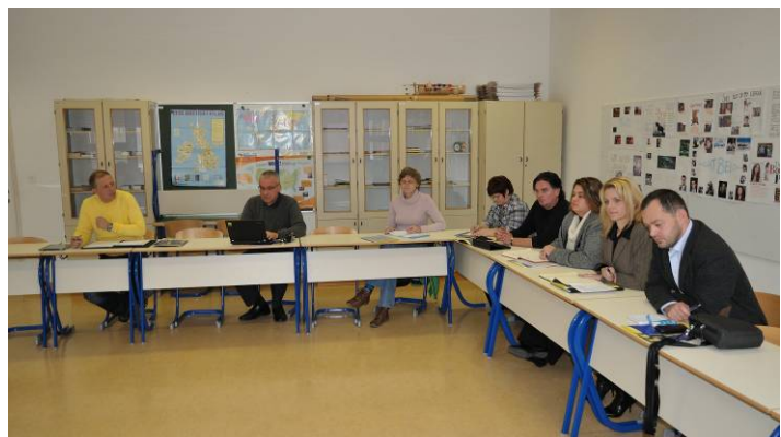
Udeleženci 3. delavnice o pristojnostih svetov staršev