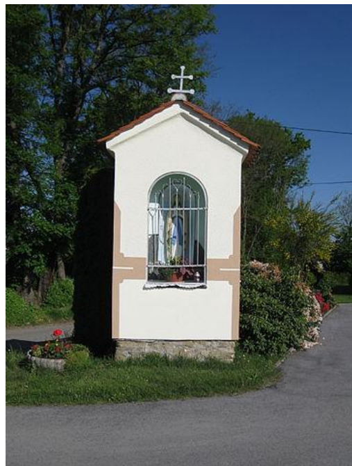
Fotografija št. 13 : Znamenje ob cesti v Boračevi

(Znamenje iz 19. stol. je povsem brez profilacije. Večja niša ob cesti in dve manjši sta poslikani. Znamenje pokriva dvokapnica za bobrovcem.)