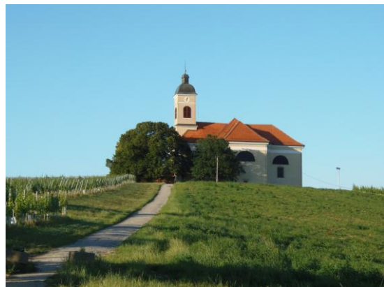
Fotografija št. 10 : Cerkev sv. Marije Magdalene

1885 jo je poslikal Jakob Brollo; 2002 so bile postavljene nove orgle.)