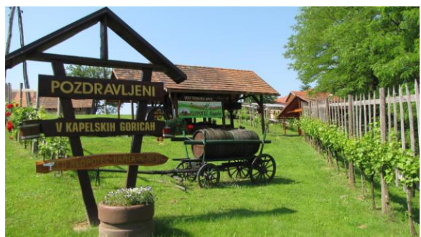
Fotografija št.8 : Pri preši na Kapeli

(Osrednji prostor dogajanj in prireditev tako TD Klopotec Kapela kot Društva vinogradnikov in ljubiteljev vina Kapela;Paričjak 21. Po obnovi, ki se je pričela 2001. leta, tam najdemo obnovljeno vinogradniško prešo, lesen vinski sod (prostornina 6100 litrov, potomko najstarejše vinske trte iz Maribora, tipični štajerski klopotec in kužno znamenje; postavljeno je bilo okoli leta 1680 (v 17. stol.), ko se je po teh krajih širil kuga.