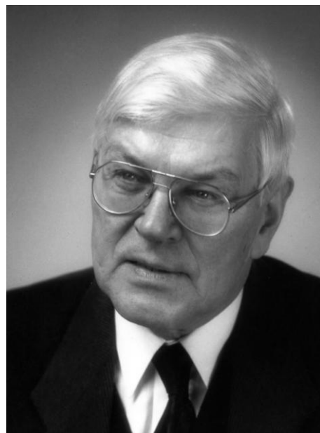
Fotografija št. 1: Kajetan Kovič

ZANIMIVOSTI: Za njegovi najbolj znani deli: Maček Muri in Moj prijatelj Piki Jakob sta presegli okoli 100 tisoč izvodov. Kajetan ni maral psov, saj ga je v otroštvu pes ugriznil v lice. Je prejemnik številnih nagrad, ki so si sledile ena za drugo. Seveda pa je tudi bil časn občan Občine Radenci.