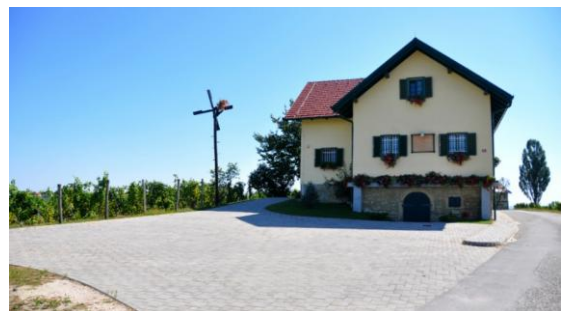
Fotografija št. 11: Vinotoč Belak

(Vinotoč je obnovljena, 400 let stara, zidanica, kjer si lahko ogledamo eno večjih lesenih preš v Sloveniji.)