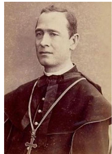
Fotografija št. 5: Jakob Missia

Kardinal Jakob Missia se je rodil 30. 6. 1838 v Hrastju Moti pri Radencih, umrl pa 24. 3. 1902 v Gorici na Primorskem. Bil je prvi kardinal slovenskega rodu; njegov vzdevek je bil »škrlatni princ«. Prvotno se najbrž pisal Mislej (kasneje so namreč pri prepisih spremenili njegov slovenski priimek v latinskega, kar bi lahko komu dalo vtis, da gre za italijanskega kardinala). Njegovi domačiji v Hrastju Moti se je reklo »pri Mislovih«.