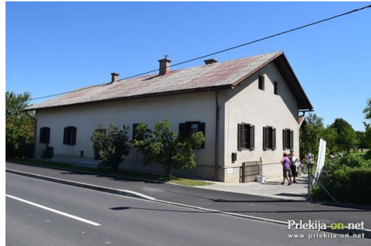
Fotografija št 6. : Domačija sorodnikov Kajetana Koviča

Domačija sorodnikov Kajetana Koviča, Hrastje-Mota