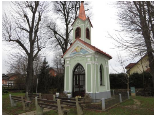
Fotografija št. 12 : Kapelica v Boračevi

(Neoklasicistično kapelico z zvonikom iz l. 1874 členijo pilastri, podstrešni venec in trikotno čelo; Izhaja iz tretje četrtina 19. stol; Stoji v središču vasi med divjima kostanjema, zahodno od ceste Boračeva – Radenci.)