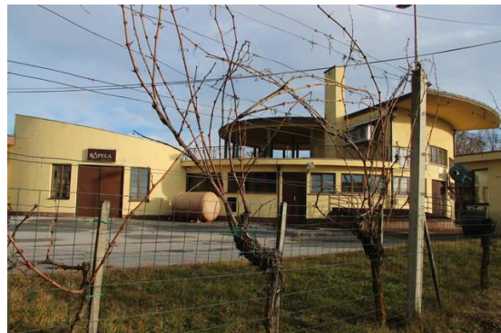
Fotografija št. 9: Vinska klet Kapela

Vinogradniška in vinarska tradicija kraja sega že v leto 1300.)