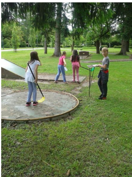
Fotografija 5: Mini golf

Štafetne igre se izvajajo na igrišču pred dijaškim domom, mini golf pa v radenskem parku.