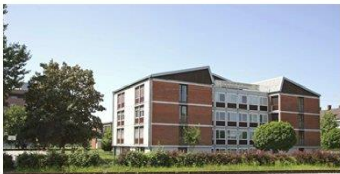
Fotografija 2: Dijaški dom Radenci

Izvajalci: Skupina učenk Bubla, učitelj zgodovine