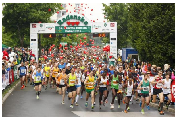
Fotografija 1: Maraton treh src