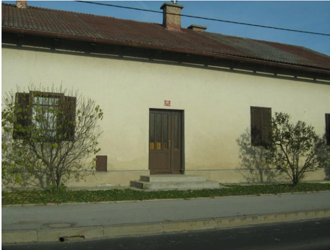
Fotografija 14: Spominska hiša Kajetana Koviča Radenci