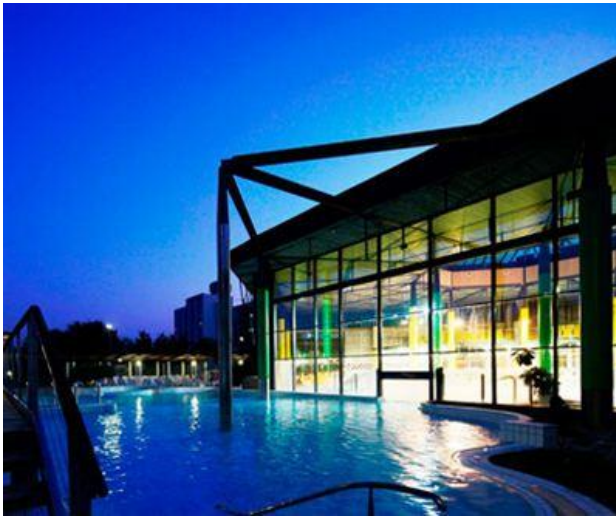
Fotografija 6: Terme Radenci