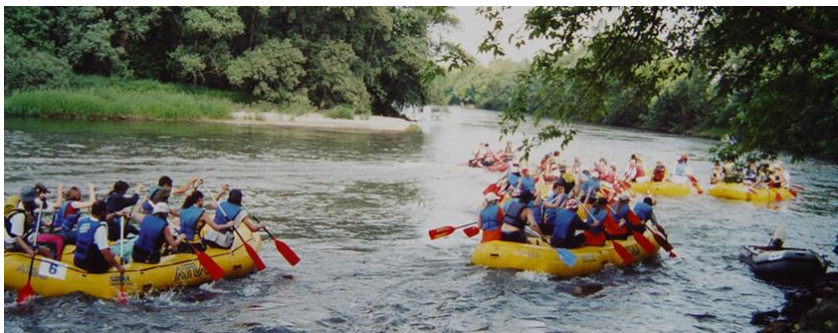
Fotografija 4: Rafting po reki Muri